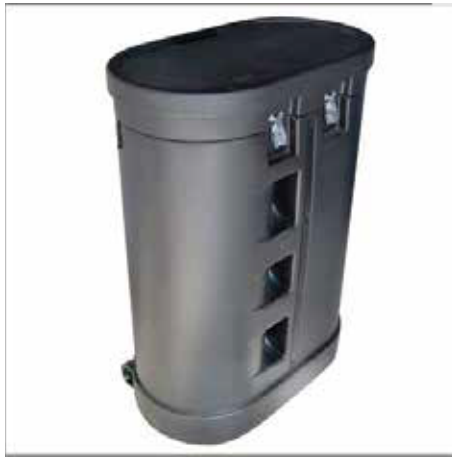
Carro estuche de Lujo. Impresión en tela arte para carro estuche de lujo 180x79 cm.