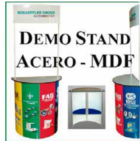
Demostand metal-mdf semicircular. Con vinil tinta látex sin laminado.