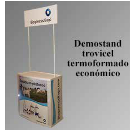
Demostand económico de trovicel. Con vinil tinta latex a 1200 dpi's.