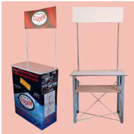
Demostand POP-9 Con gráfico en lona 159x86 cm. Con gráfico en tela sublimada 159x86 cm.