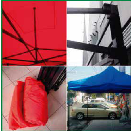
Estructura Carpa sencilla con lona.