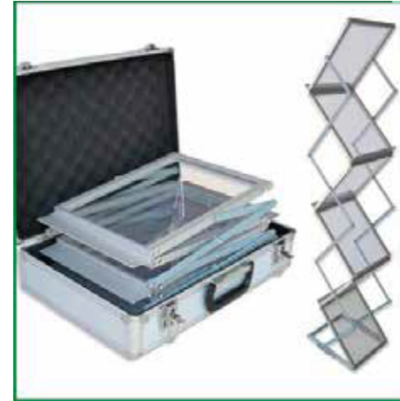
Folletero con Maleta de Aluminio.

Estructura de acero en acabado negro, conectores de material plástico, medidas 3X3 m., pregunte por existencia de colores: Rojo, Azul y blanco. Empacada en caja, sin estuche. Venta por separado de estructura y/o toldo. Peso aprox. de 20 Kg.