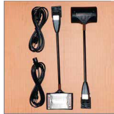
Juego de Lámparas 150 w.