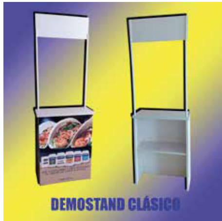
Demostand clásico. Con vinil tinta latex sin laminado.